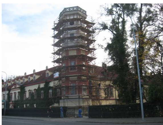
Oprava fasády věž