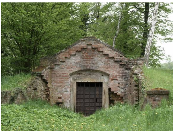
lednice v zámeckém parku před opravou