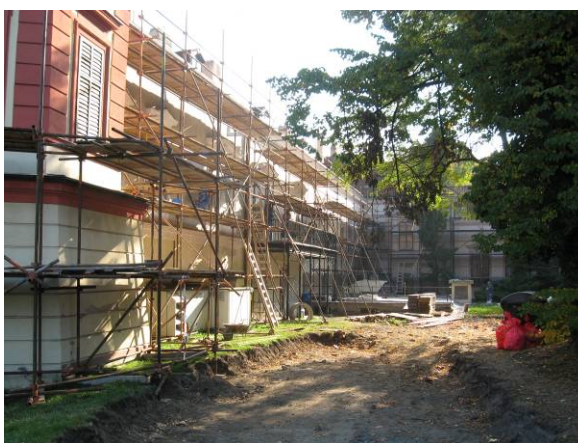
oprava fasády západní křídlo a opravy plochy pro kontejnery