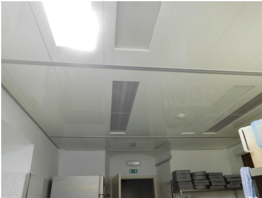
Plochý stropní systém ve výdejně stravy