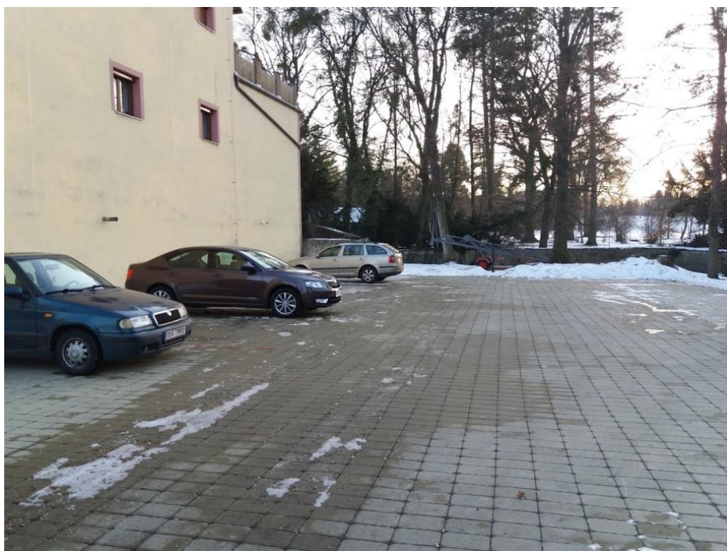
Parkoviště – 16 míst