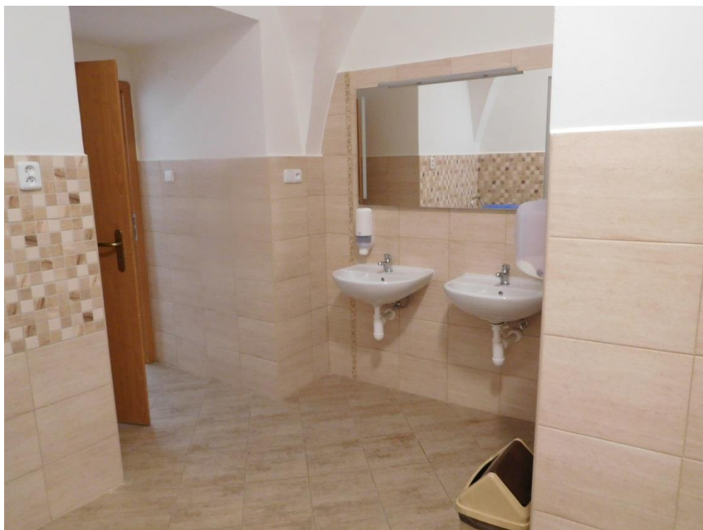
Modernizace koupelny v přízemí domova