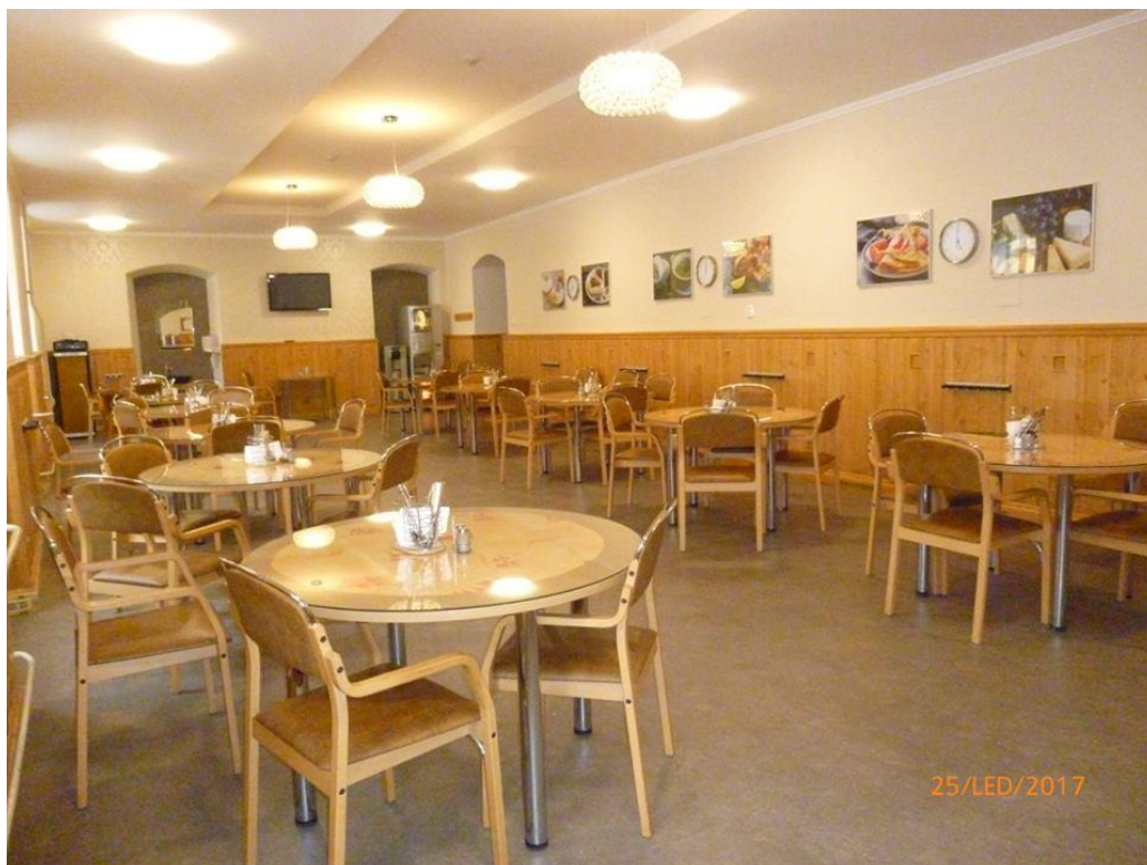
Designové úpravy jídelny