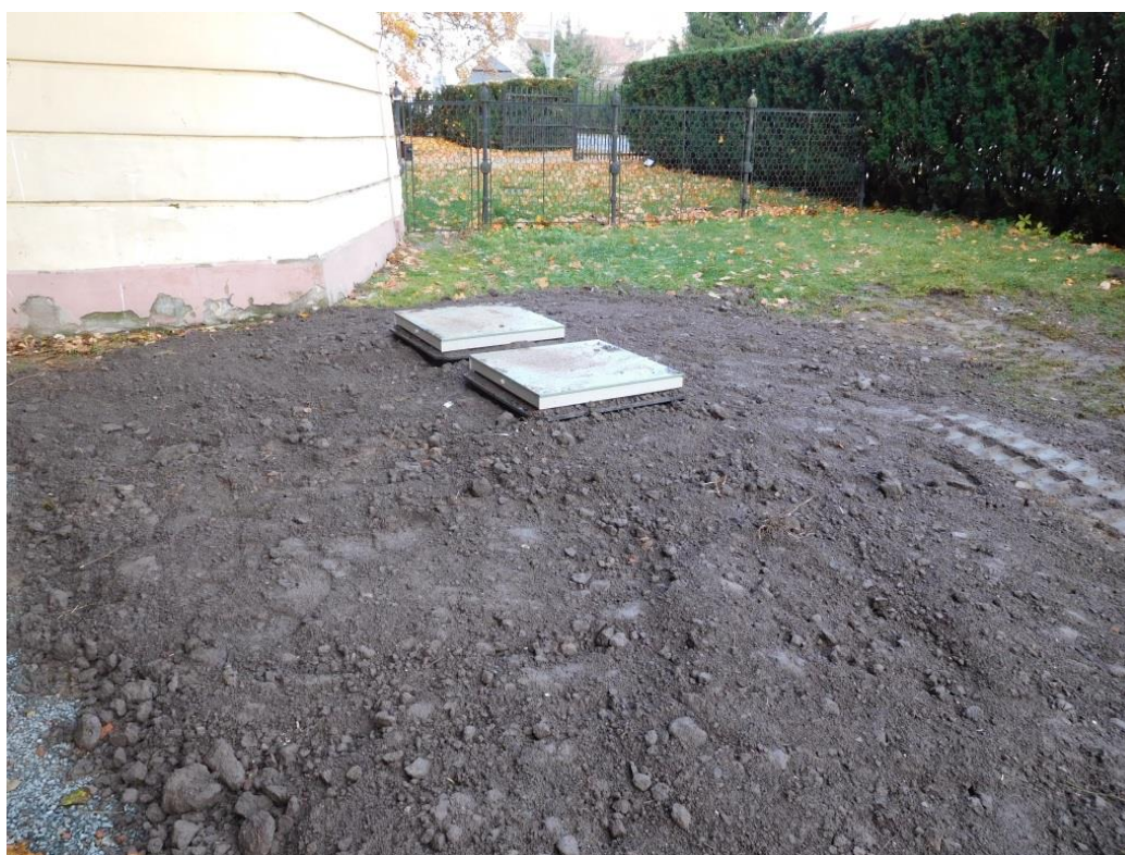
Výměna lapáku tuku z kuchyně