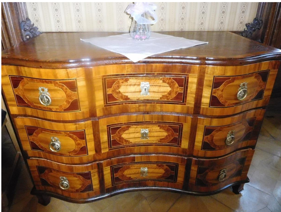
Restaurování zámeckého nábytku