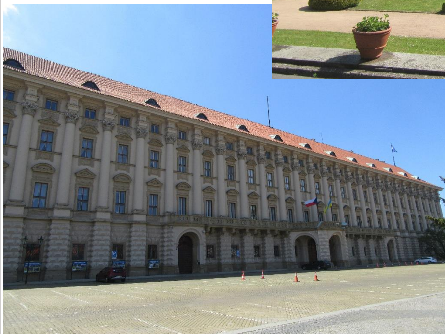
Fotografie č. 3