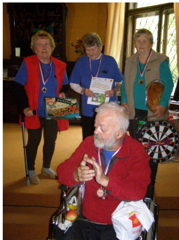
3. Místo Koroptve, DS HM U Bažantnice