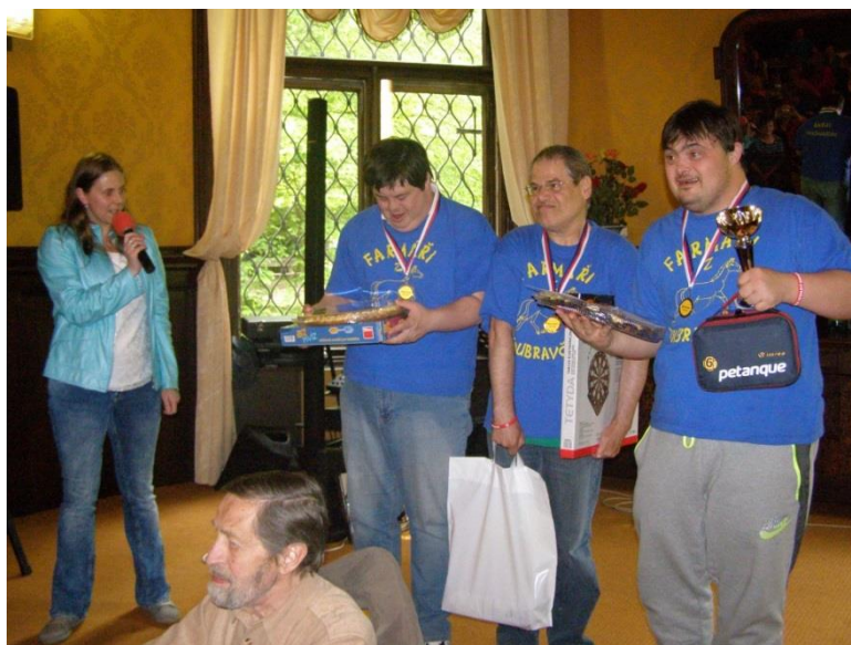
1.Místo – Farmáři 1, Doubravčany

3. MÍSTO – TÝM KOROPTVE , DS HEŘMANŮV MĚSTEC, U BAŽANTNICE