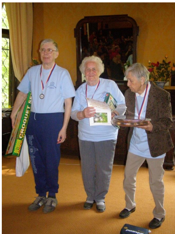
2. místo – DS Chodov