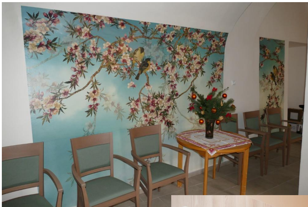
Vstup v přízemí na stanici A.

Máme opravenou šatnu pro zaměstnance s pěkným novým vybavením.