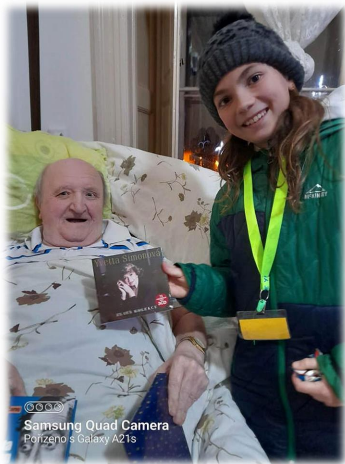
Samsung Quad Camera Pořízeno s Galaxy A21s