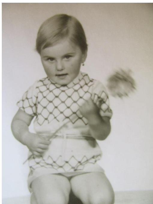
Fotografie č. 1

Představuji vám další tři dámy, každá pracuje na jiném oddělení či úseku, ale máte možnost se s nimi vidět po celém zámku i na vile: