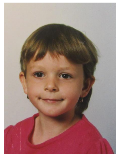
Fotografie č. 3