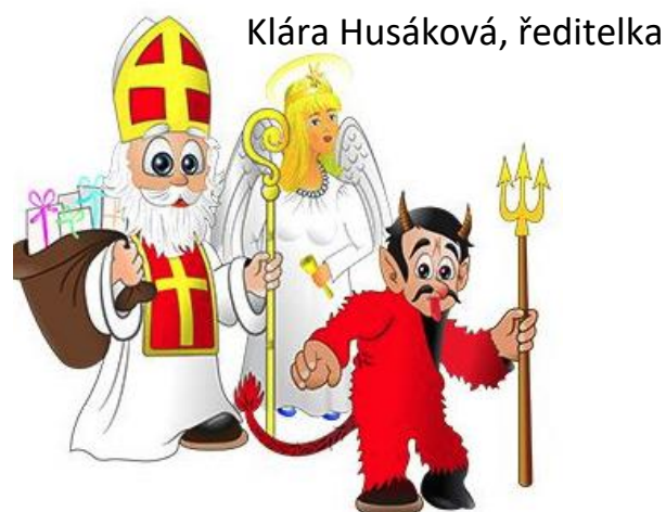
Klára Husáková, ředitelka

S tímto přáním se s vámi loučím a vřele děkuji všem kolegyním a kolegům za celoroční dobře odvedenou práci a našim seniorům a přátelům děkuji za podporu a pochopení.