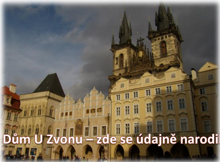
Dům U Zvonu – zde se údajně narodil

Václav IV. Vládl v letech 1346 – 1378. Václav IV. se narodil v roce 1316 . Jelikož docházelo ke sporům mezi jeho rodiči (matka byla velkou intrikánkou), vyrůstal v izolaci od své matky. V 7 letech byl odvezen do Francie na výchovu. Studoval na pařížské univerzitě, naučil se mnoho jazyků: češtinu, latinu, francouzštinu, italštinu a němčinu. Po svém kmotru, francouzském králi Karlovi se nechal přejmenovat na Karla IV. Po 7 letech se stal správcem rodových držav