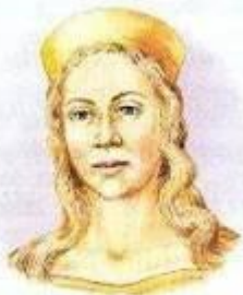
Anna Svídnická, třetí manželka Karla IV.

Anna Svídnická – třetí manželka (1339-1362), dědička slezského Svídnicka, matka budoucího krále Václava IV. V době sňatku jí bylo 14 let. Kromě Václava měla i dceru Elišku.