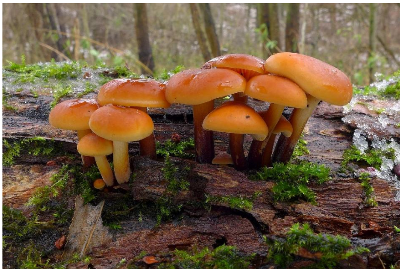
Sametonožka původní forma

Začal nám nový rok a i v něm vás budu postupně seznamovat s dalšími dřevokaznými houbičkami, které můžete najít nejen v našem parku, ale i jinde v přírodě. Všimněte si, že máme již pátý díl a stále se držíme ve spektru jedlých a léčivých hub. Navíc velké množství těchto hub roste přes zimu a náruživým houbařům pomáhá perfektně vykrývat celý rok a zamezuje tak „houbařským abstinenčním příznakům“ 😊.