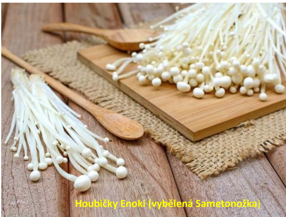
Houbičky Enoki (vybělená Sametonožka)

Největší využití u nás má Sametonožka jednoznačně v kuchyni. Sbírají se jenom kloboučky a mají výraznou, houbovou chuť. Vaří se z ní podobná jídla jako z hlívy a skvělá je i nakládaná v octě. Já jí mám nejradši ve směsi na topinky. Gurmáni možná znají luxusní houbičky Enoki, které jsou v poslední době známé z kuchařských soutěží a drahých restaurací. Nejde o nic jiného, než o „vybělené“ penízovky pěstované za nepřístupu světla (něco jako chřest a čekanka).