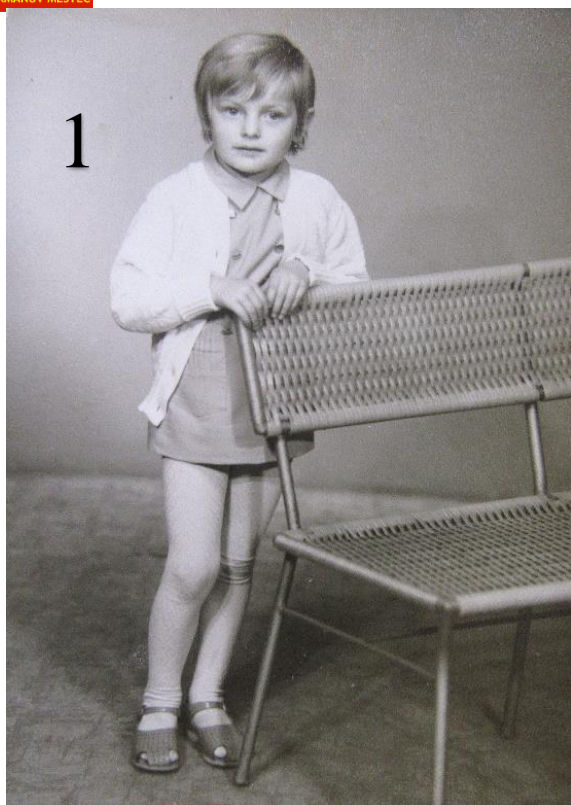
Fotografie č. 1