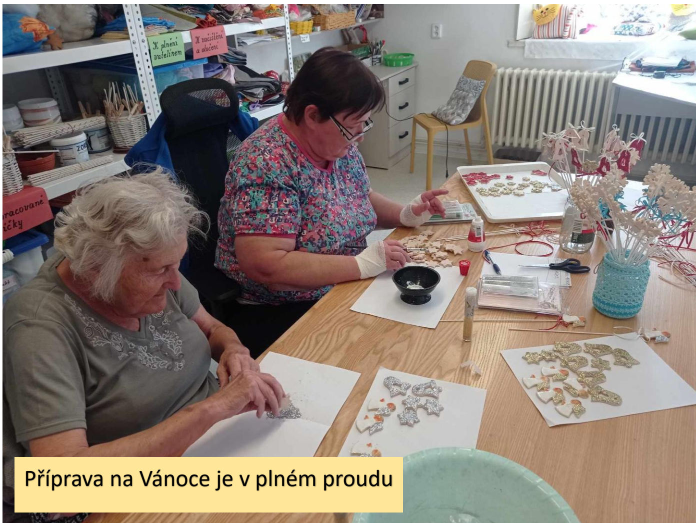
Příprava na Vánoce je v plném proudu

Napište co nejvíce zvířat na počet předepsaných písmen.