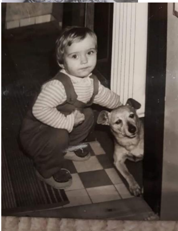
Fotografie č. 2