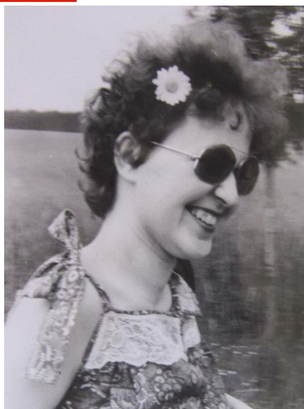
Fotografie č. 1